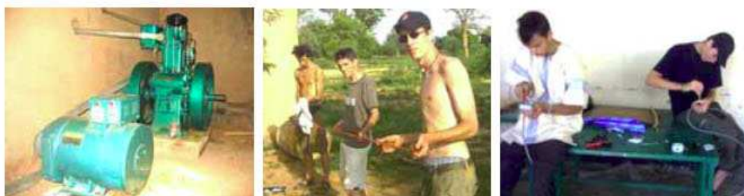
Un moteur alimente un alternateur, on tire un câble, on branche... et la lumière fut !